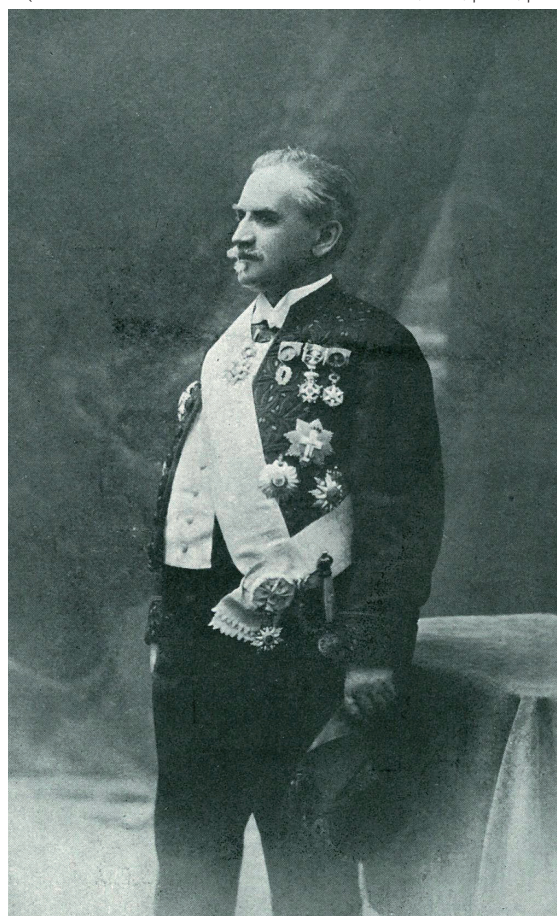
Edmond Perrier (1844-1921).

(in Bulletin de la Société d'acclimatation de France, 1921, p. 145, pl. II).